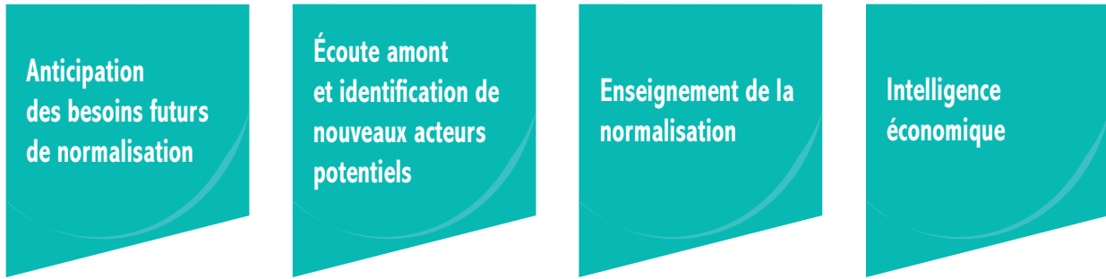
Figure 1 – Thèmes prioritaires pour l'action du Fonds

L'examen des premiers projets a permis de préciser la stratégie de ciblage. La figure suivante résume les thèmes sur lesquels le Fonds centre son action :