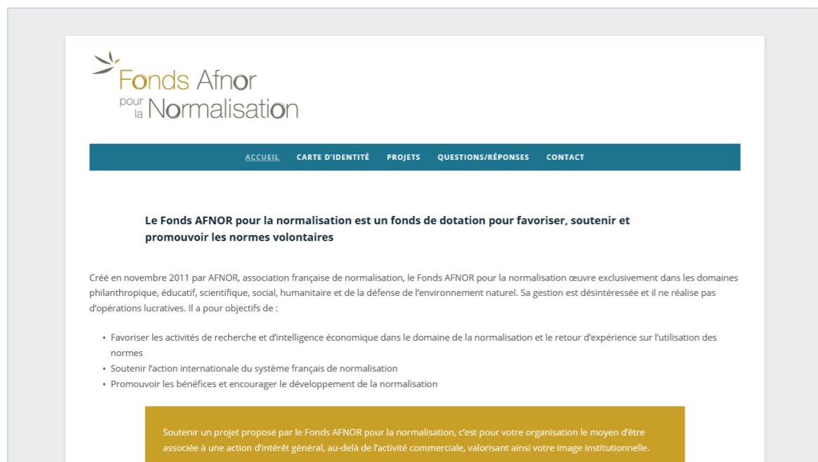
Figure 2 – Page d'accueil du site web https://www.fonds-afnor-normalisation.org/

Cette ressource électronique en ligne permet de placer à disposition des personnes intéressées :