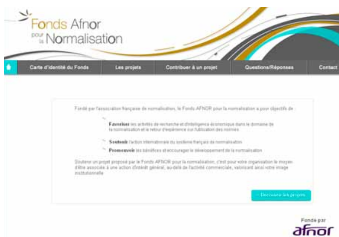
Page d'accueil du site web www.fonds-afnor-normalisation.org

Cette ressource électronique en ligne permet naturellement de placer les statuts du Fonds à disposition des personnes intéressées.